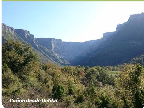
Cañón desde Delika

MATRÍCULA: socio/as gratuita, no socio/as: 5€