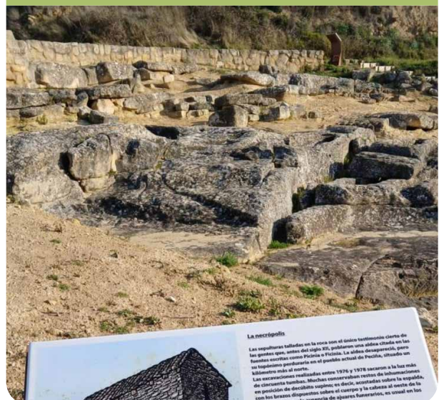
La necrópolis Las sepulturas talladas en la roca son el único testimonio cierto de los griegos que, antes del siglo VII, poblaron una zona situada en los límites entre la Rioja y el País Vasco. La aldea desapareció, pero su topónimo perduró en el nombre actual de Peralta, situado a unos kilómetros más al norte. Las excavaciones realizadas entre 1976 y 1978 sacaron a la luz más de cincuenta tumbas. Muchas conservaban restos de iluminación: en posición de descubierto sugiere, en efecto, acendrada tal vez la espada, con los brazos dispuestos sobre el cuerpo y la cabeza al oeste de la tumba. Entre ellos, y la ausencia de ajuares funerarios, se cree en los griegos. Entre ellos, y la ausencia de ajuares funerarios, se cree en los griegos.

MATRÍCULA: socios/as gratuita (desplazamiento) comida a cuenta de los/as asistentes