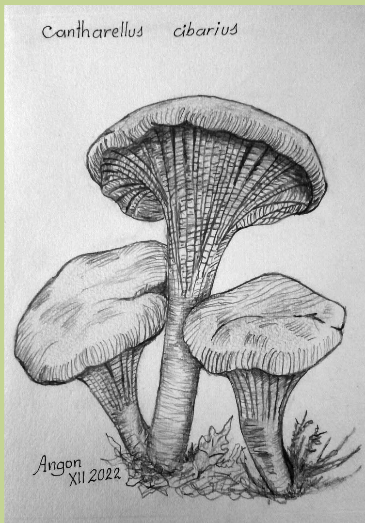
Ilustr. Antonio González

El programa podrá ser modificado tanto en su contenido como en las fechas, anunciándose los cambios en la web, en tal caso, con antelación suficiente.