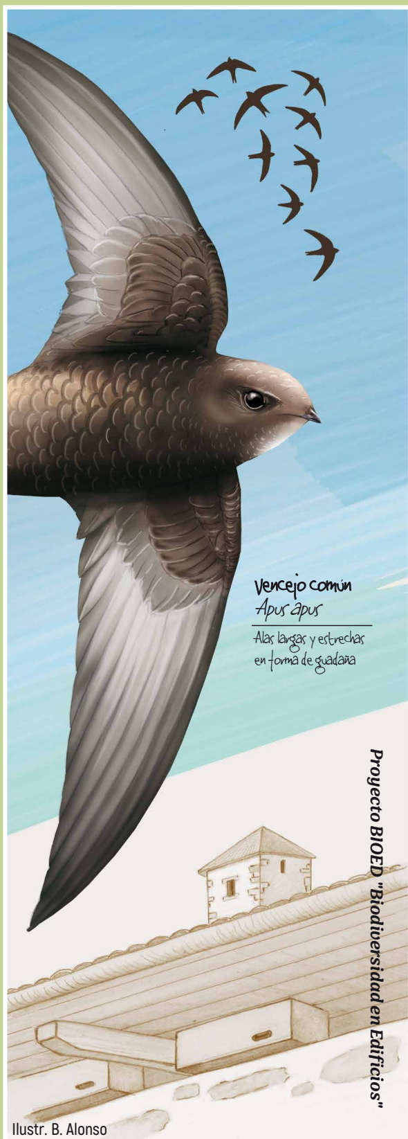
Vencejo común Apus apus Alas largas y estrechas en forma de guadara

Proyecto BIOED "Biodiversidad en Edificios"